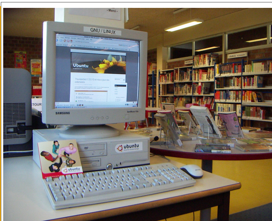
Illustration 1: Ubuntu au CDI

Fort de l'accord cadre 1 du 28 octobre 1998 et riche de mon expérience personnelle, j'ai décidé de participer à ma mesure à la promotion du libre au sein de l'Éducation nationale. Désireux de lutter contre la fracture numérique et de permettre un pluralisme technologique garant de la neutralité commerciale de l'Éducation nationale, je me suis décidé à installer une machine sous GNU/Linux. Ainsi, je tiens à décrire dans le détail la procédure d'installation afin de donner un aperçu des possibilités d'un tel système ainsi que du temps nécessaire pour l'installation d'un poste au sein du Centre de Documentation et d'Information d'un collège. Il s'agira par la suite de rendre compte de quelques difficultés notamment liées à la question inhérente des logiciels propriétaires peu enclin à promouvoir des outils multi-plateformes et des moyens de contourner ces inconvénients. Pour conclure, nous laisserons la parole aux usagers.